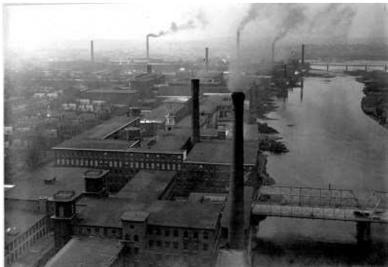
Paysage industriel de Lowell, dans les années 1920

couramment. Mais à partir des années 1960, la laïcisation grandissante de l'enseignement aux États-Unis a mis fin à l'enseignement du français à Lowell. De nos jours, les descendants d'origine canadienne-française apprennent le français comme toute autre langue étrangère à l'école.