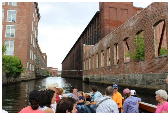
Touristes profitant d'une croisière sur les canaux

De nos jours, une visite de ce grand parc national permet de parcourir des bâtiments industriels aménagés fidèlement comme ils pouvaient l'être vers 1840. Le Suffolk Mills en est un exemple, avec son énorme système de turbines qui propulsait les moulins à coton. On peut également faire un tour de bateau sur les canaux aménagés artificiellement pour fournir de nombreux moulins en eau.