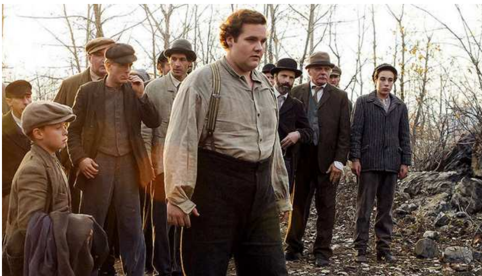
Scène de Louis Cyr : l'Homme le Plus Fort du Monde .

En lisant l'édition de janvier 2019 de la revue américaine The NUMISMATIST , j'apprends qu'en février la US Mint lance un nouveau « quarter dollar » sur le Parc National Historique de Lowell. Il s'agit de la première pièce du programme America The Beautiful Quarters pour 2019.